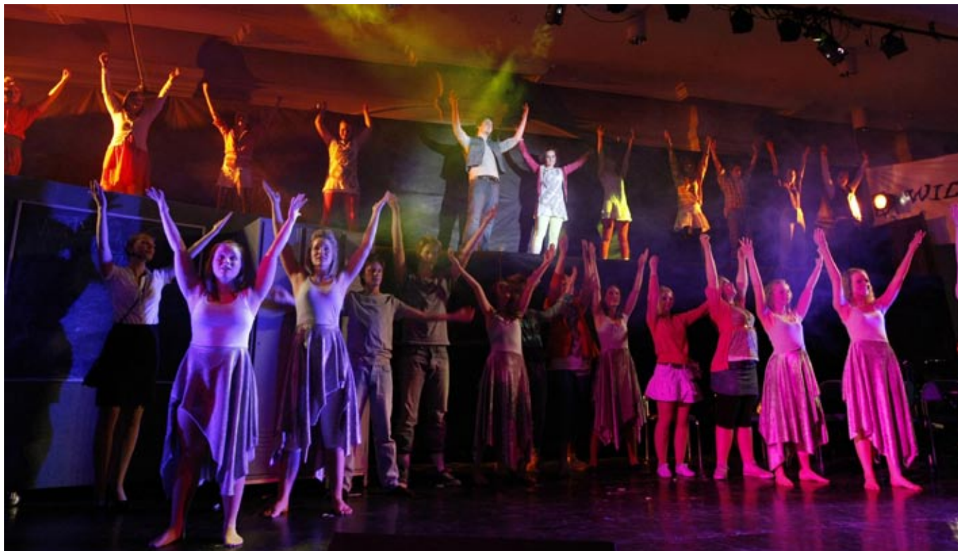
stort ensemble: Mange på scenen når Kristiansand kulturskoles musikalgruppe igjen viste sine kvaliteter på scenen i Musikkens Hus.