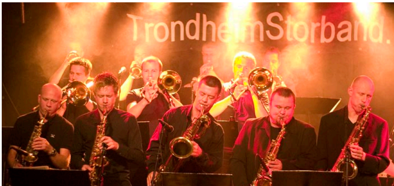
så det svinger: Trondheim Storband byr med heftige rytmer opp til dans på Kulturskoledagene 2008.