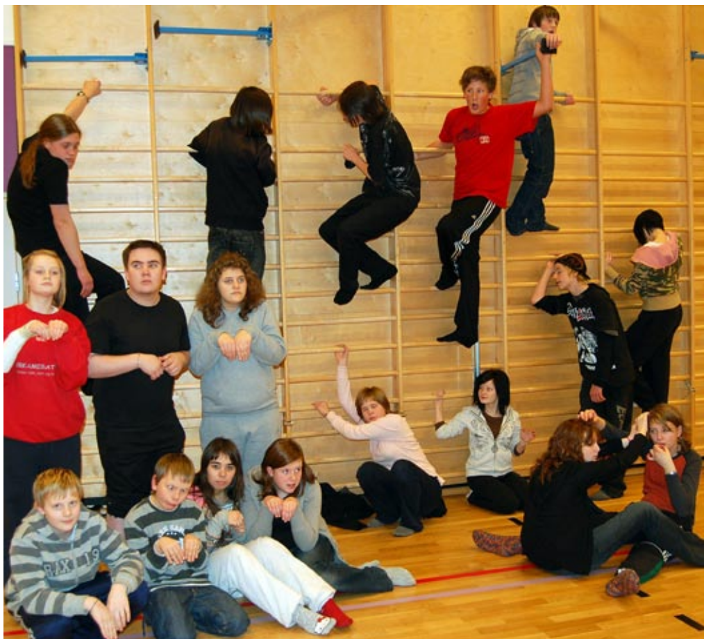
spøkelsler på toten: Elever fra Vestre Toten kulturskole deltok i forestillinga "Døde helter".

I Lenvik og Målselv mener dramalærerne og kulturskolelederne at kulturskolene kanskje har noe å lære av idrettskultur-