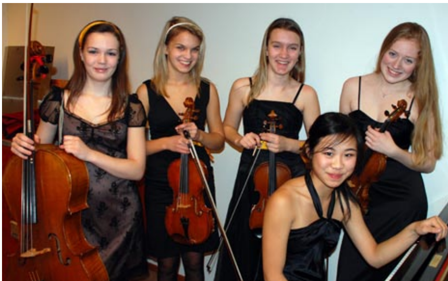
prøver igjen? Gullfiskene gjorde det skarpt i fjorårets UMM og kan stille i år også, siden ensemble er konkurranseklasse hvert år.

- Vi tror de regionale mesterskapene er glimrende mål å jobbe mot for alle viderekomne elever og studenter under 23 år. Hvis det ikke er tilbud for ditt instrument i år, så se etter muligheter for å stille som duo eller ensemble, sier Grande Lund.