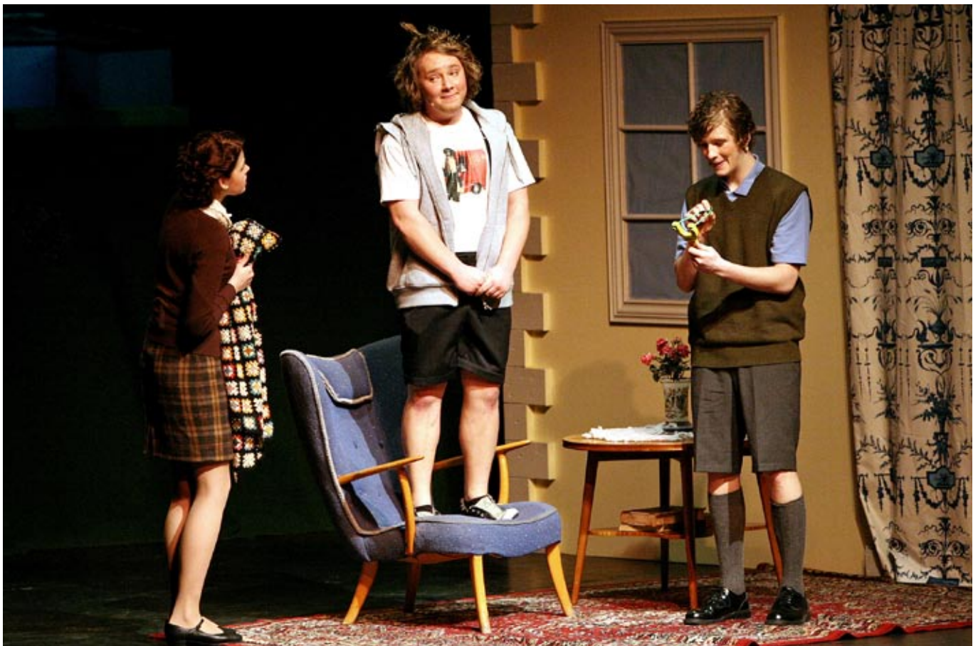
kan musikal: Kulturskolen Moss/Rygge/Våler har igjen gjort lykke med en profit anlagt oppsetning. "Blodsbrødre" denne gang.