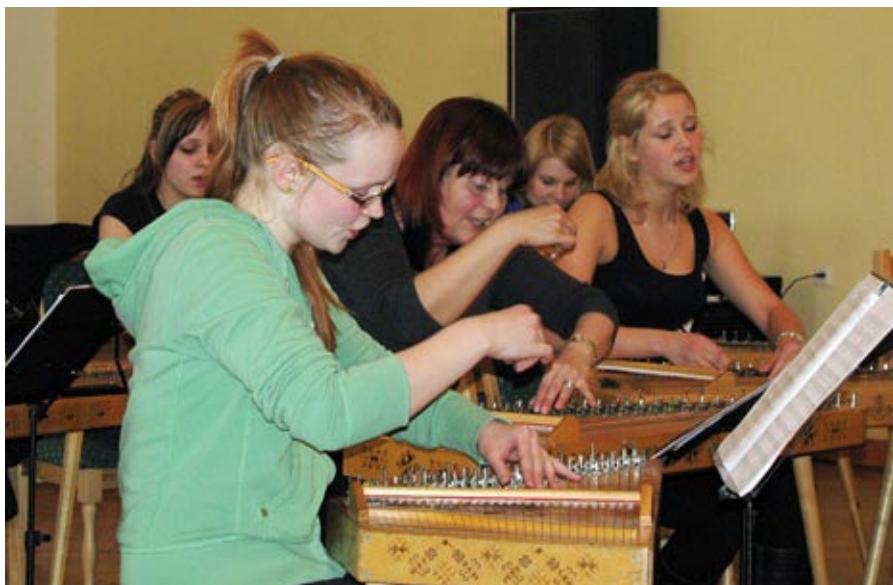
kokleensemble: Austrina kokleensemble fra Rigas skolenu pils viste hordalendingene sine kunster.

– Undervisningen var preget av ro, konsentrasjon og arbeidsdisiplin. Læreren stilte store krav til eleven, men hadde også omsorg for eleven. Vi fikk inntrykk